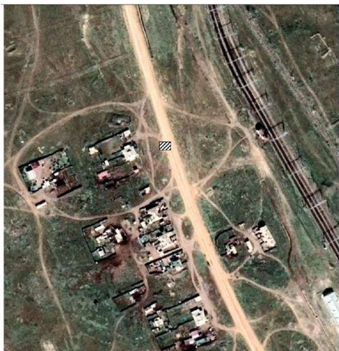
СХЕМА РАСПОЛОЖЕНИЯ КОНТЕЙНЕРНОЙ ПЛОЩАДКИ по адресу: п.ст. Мацневская, в 60 метрах от жилого дома №5 ул. Блюхера